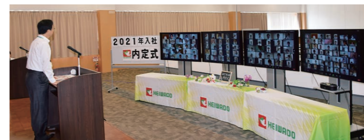
▲オンラインによる内定式の様子