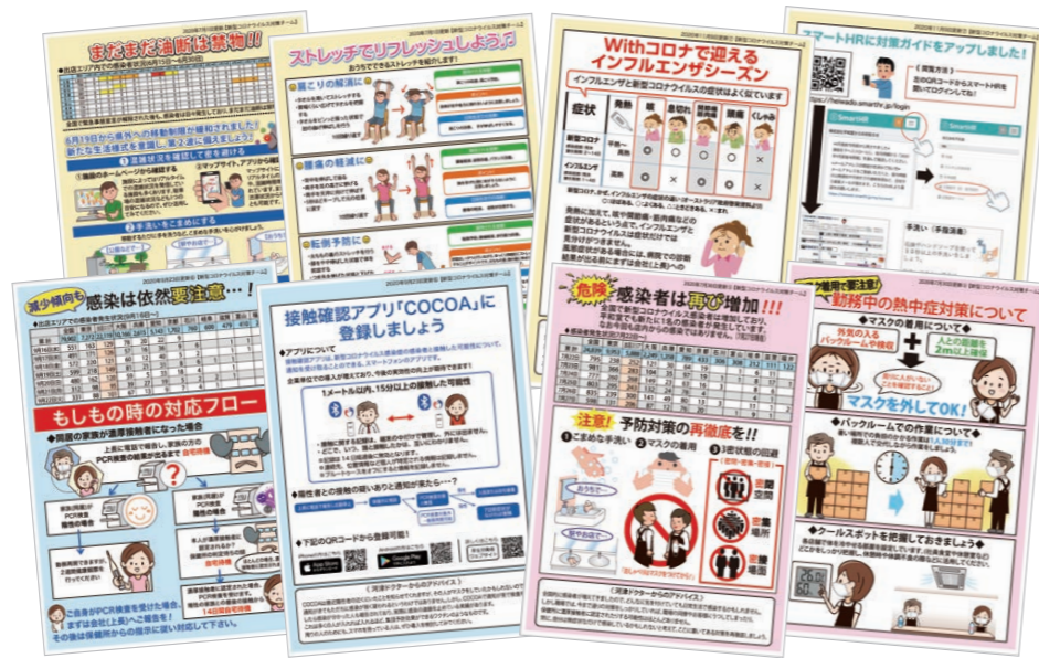
▲従業員向け新型コロナウイルス情報便